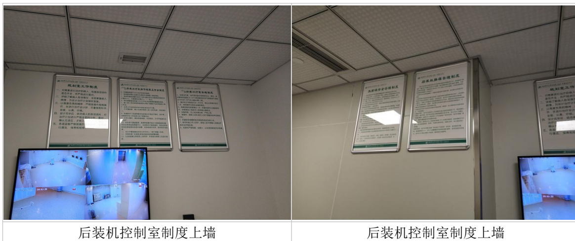
图4-1 项目制度上墙现场照片

医院制定有健全的操作规程、岗位职责、设备检修维护制度、人员培训计划、辐射监测方案、辐射事故应急预案等，并已张贴上墙，具体制度名录如下：《放射诊疗安全与防护管理制度》、《辐射安全和防护监测方案》、《放射工作人员辐射安全与放射防护培训计划》、《放射工作人员个人剂量监测制度》、《放射工作人员职业健康管理制度》、《放射辐射危害告知制度》、《放疗科放射事故应急处理预案》、《后装治疗操作规程》。